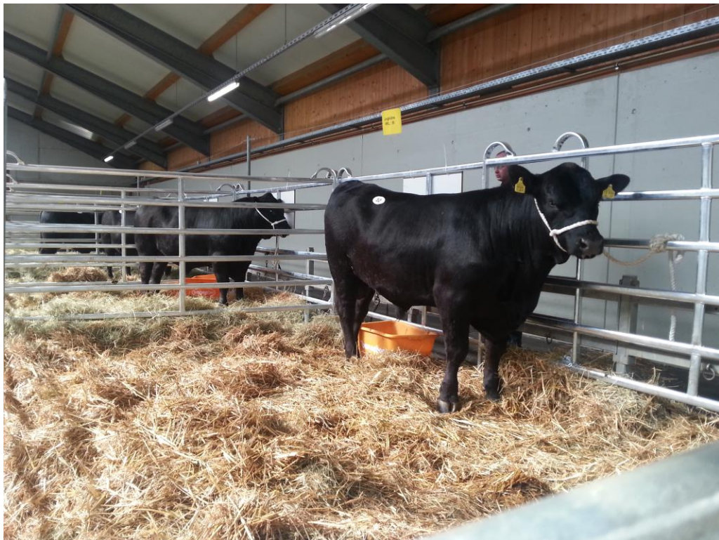
Legarea animalului pentru obisnuire zilnic