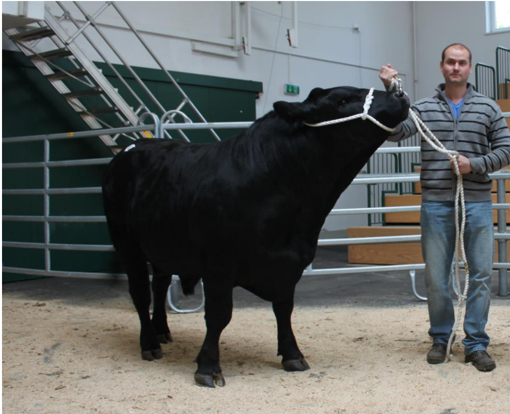
Prezentare de bovine în ring