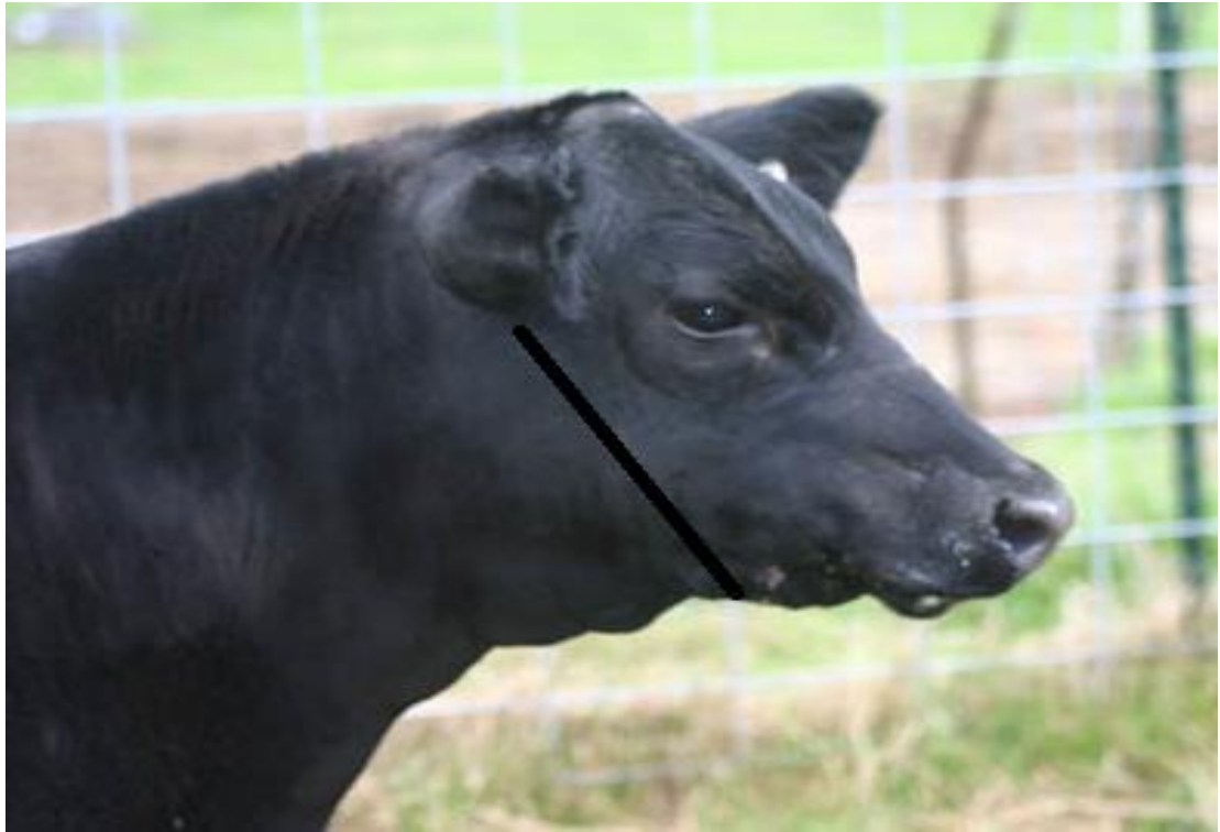
Zona din dreapta liniei negre se tunde